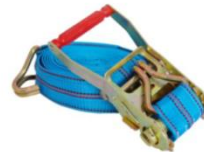
調整式安全ベルト