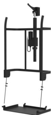
合金鋼材質 耐摩耗性