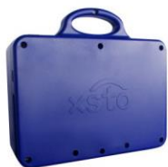
バッテリーパック