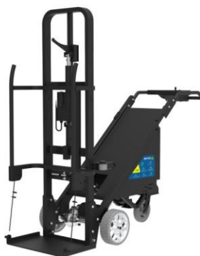
簡単に取り付け 簡単操作