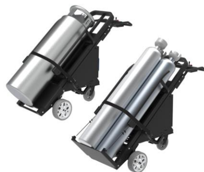
様々なガスボンベ を適用