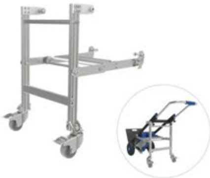
格納可能な第4ホイールアタッチメント