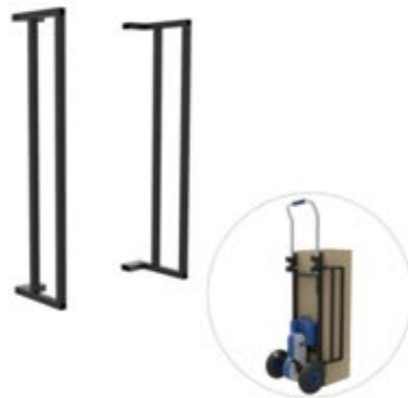
ガードレール延長治具