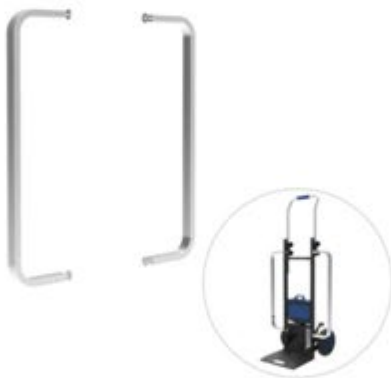
長尺ボディークランプ