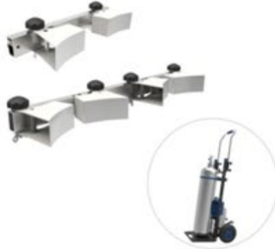
ガスボンベ固定具